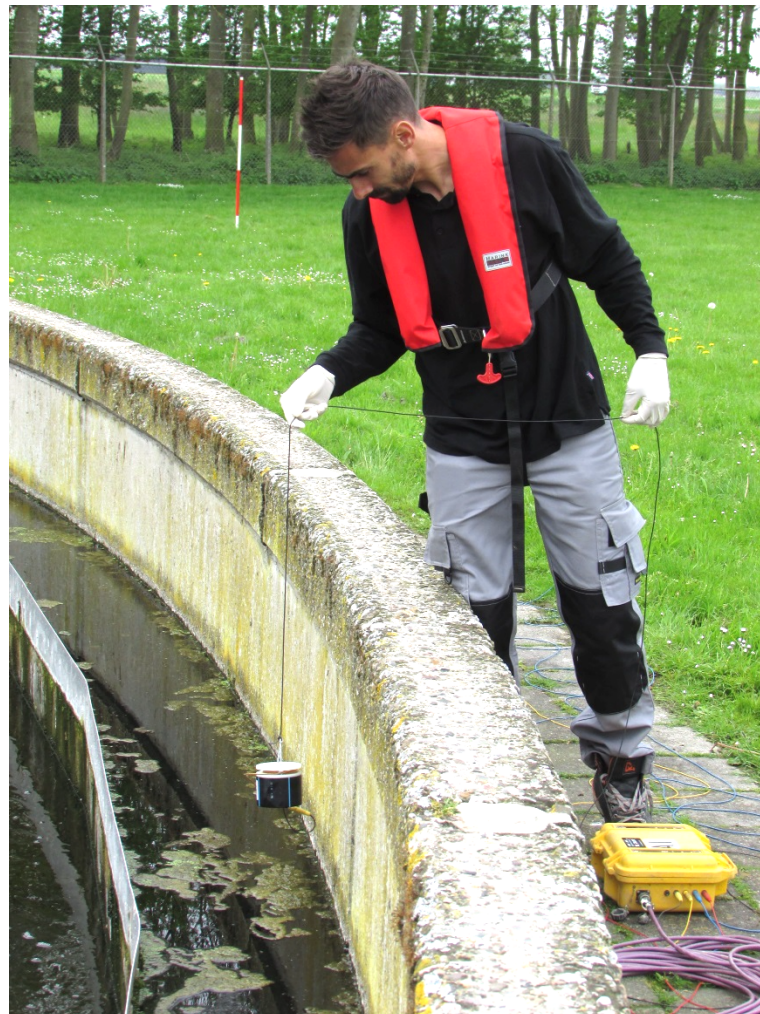
Foto: Aanbrengen meetelektrode.