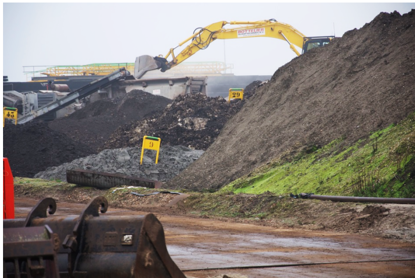
Foto: Risico op energieoverslag.

Voorafgaand aan de geo-elektrische meting moet worden beoordeeld of een energie overslag van de te inspecteren voorziening kan plaatsvinden, die de meting beïnvloedt. Als er getwijfeld wordt of energieoverslag plaats kan vinden, dan kan vooraf op locatie een testmeting of nader onderzoek ter plaatse van de rand worden uitgevoerd.